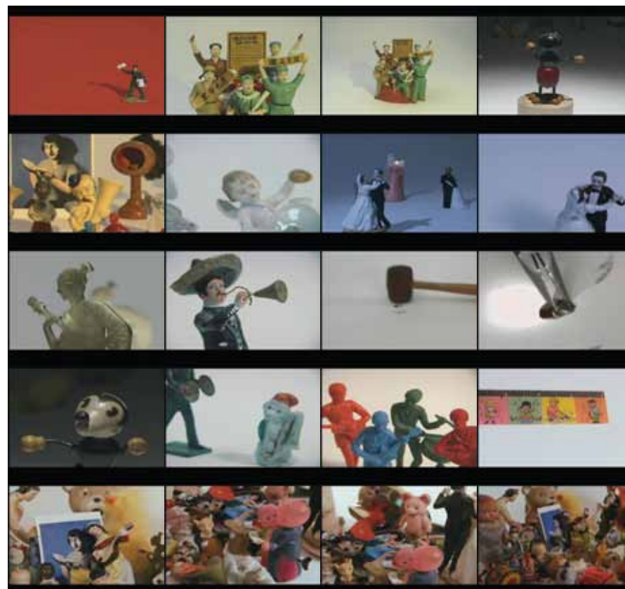
LILIANA PORTER (1941-) Fox in the mirror (2008) DVD. Duración: 20' 19"