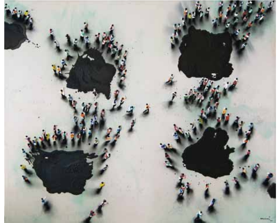
JUAN GENOVÉS (1930- ) Huellas (2007) Acrílico sobre Lienzo

En estos tiempos de postmodernidad tardía y globalización creativa, los artistas experimentan nuevas técnicas y disciplinas. La pintura busca nuevos soportes y muestra una importante y mutua influencia de la fotografía, la escultura emplea gran variedad de materiales y se consolida la instalación, el vídeo y los nuevos medios como la animación y el web ar. Surgen nuevos temas: la identidad, el género, el feminismo, el cuerpo, el "queer", la posmodernidad, la multiculturalidad, con una intención muchas veces crítica.