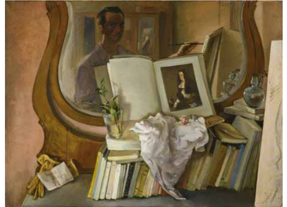
RAMÓN GAYA (1910-2005) Homenaje a Velázquez (1940) Óleo sobre lienzo

A pesar de estos difíciles momentos, surgen nuevos artistas aunque se limita cualquier manifestación de vanguardia, estos siguen recibiendo la influencia de París, sobre todo de Picasso y el cubismo que influye incluso en los más moderados