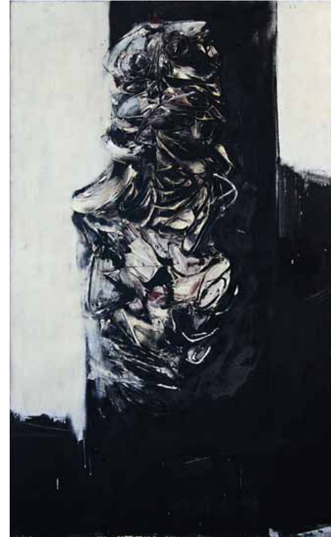
RAFAEL CANOGAR (1935- ) Personaje 11 (1962) Óleo sobre lienzo

Destacan dos tendencias: Los informalistas, gestual y/o matérico, influidos por el expresionismo abstracto americano y la pintura barroca española que les permite expresar la desesperación a través de la expresividad del gesto, la pincelada, la materia, con el grupo Dau al set (Cataluña) y el grupo El Paso (Madrid). Otras tendencias se verán muy influidas por la politización del arte, como el realismo crítico y la figuración narrativa, estas influidas por el Pop Art inglés y americano. También en Murcia comparte las inquietudes de renovación, con la fundación del Grupo Puente Nuevo y el gran desarrollo de diferentes tendencias.