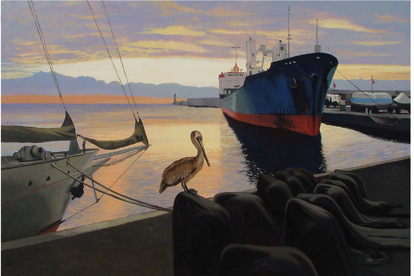
ZURCIDOS, 2006. Óleo sobre lienzo. 200 X 300 cm.