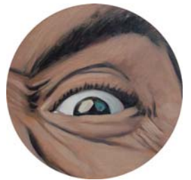
EL OJO DE DAMIEN HIRST, 2007. Óleo sobre lienzo. 30 cm diámetro.