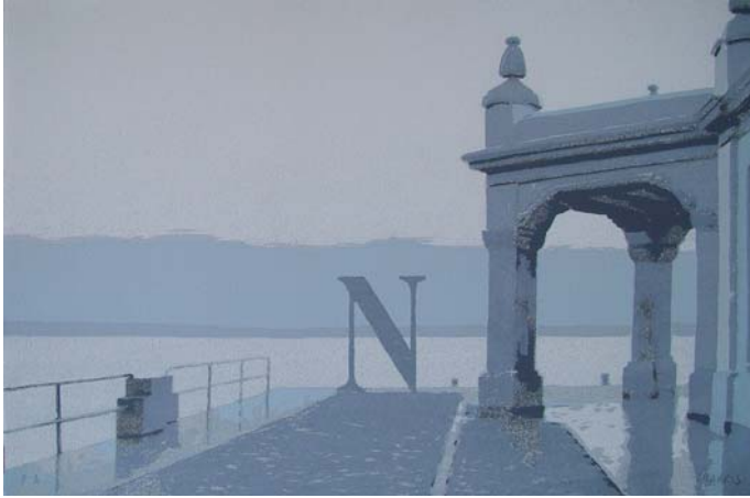
NORTE, GEOGRAFÍA, 1997. Serigrafía. 38 x 56 cm. Editado por Galería Siboney.

HACE AÑOS HICE UNA SERIGRAFÍA en la que aparecía el Palacete del Embarcadero. En aquella pieza, una gran N marcaba el norte geográfico, como si el coqueto edificio junto al puerto fuera una especie de brújula, una piedra de toque para viajeros decididos a cambiar su suerte y su destino. Las exposiciones que tuve en su día en Santander también eran puertas a lo exótico, y el viaje su eje principal. Siempre es una parte importante de mi trabajo, pero no sé porqué esa ciudad norteña está unida para mí con la partida y el azar, con historias de indianos y travesías inciertas. Y ahora que tengo que pintar para su sala de exposiciones vuelve la rosa de los vientos a manejar la batuta. Es curioso como la obra de un artista se compone a partes iguales de reflexión e intuición, y los presentimientos y hallazgos inesperados cobran tanta importancia como el bagaje intelectual con el que todos intentamos construir algo que interese a nuestros contemporáneos.