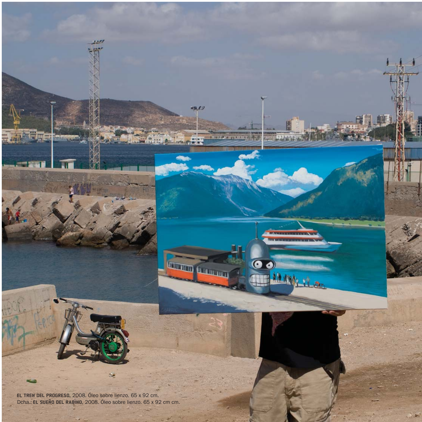
EL TREN DEL PROGRESO, 2008. Óleo sobre lienzo. 65 x 92 cm.