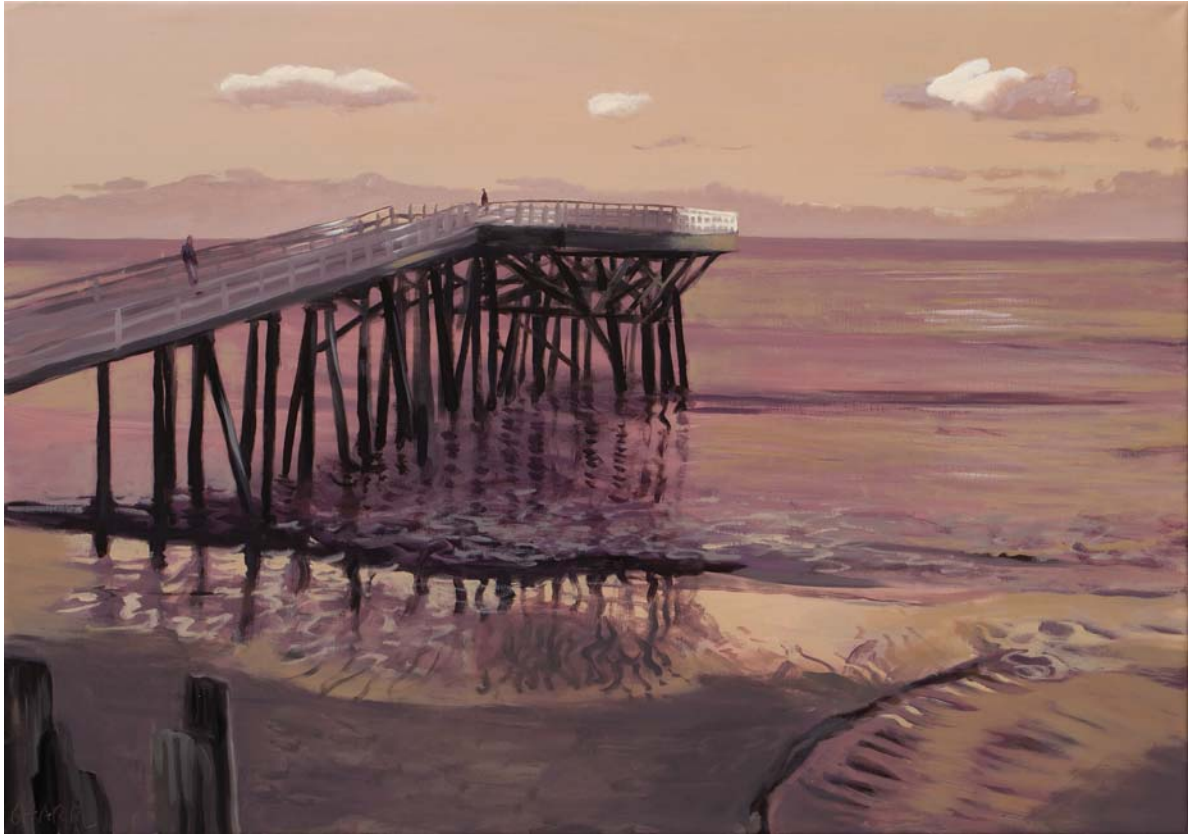
ANTES DEL TERREMOTO, 2008. Óleo sobre lienzo. 65 x 92 cm.

S OJOS QUIEREN ACARICIAR. JOHANN W VON GOETHE