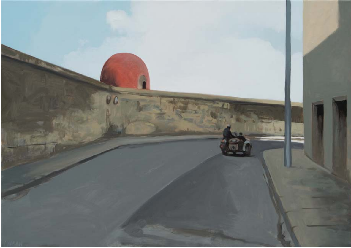
EL CAIRO, 2008. Óleo sobre lienzo. 65 x 92 cm.