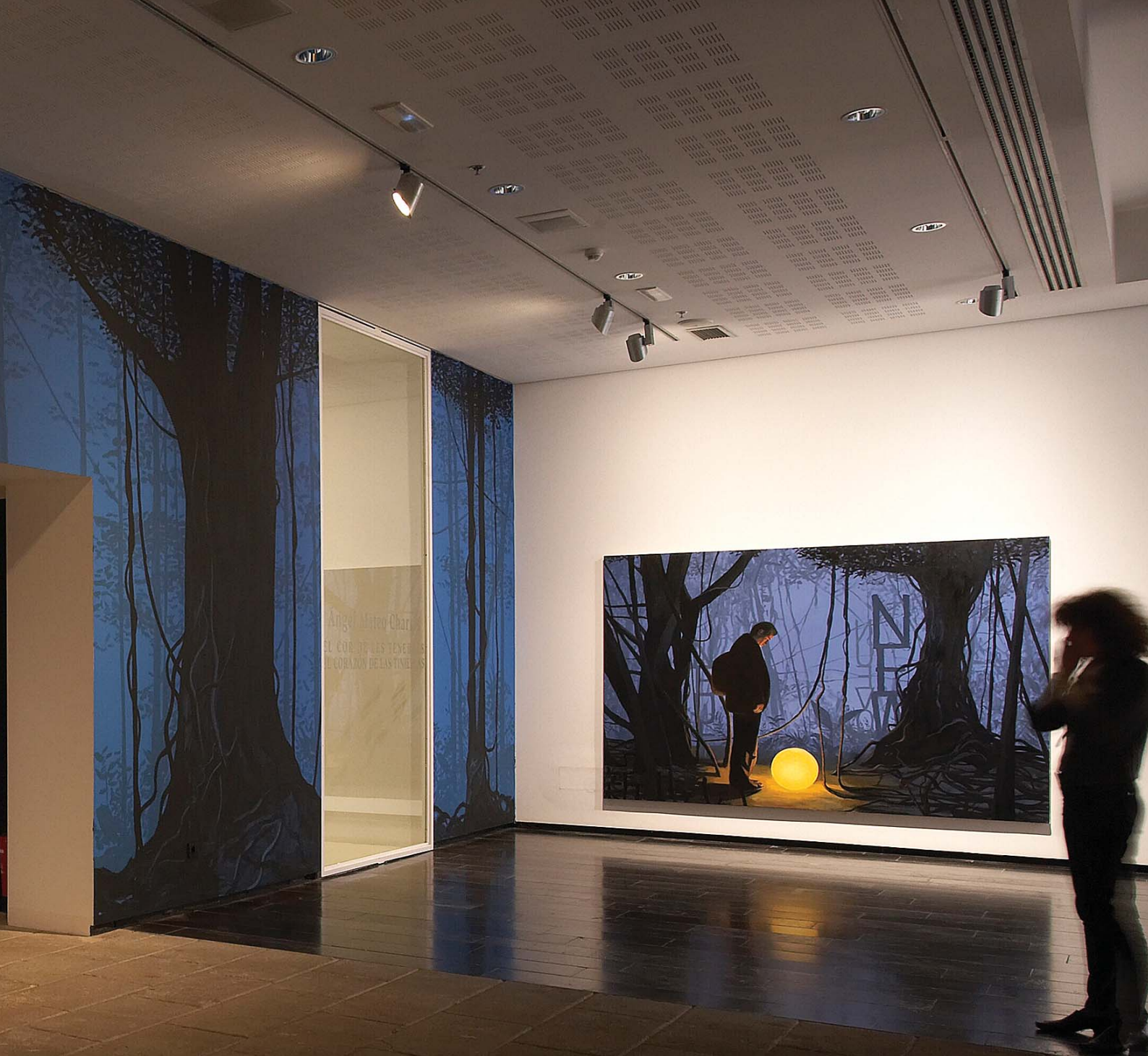
INTERVENCIÓN MURAL PARA LA EXPOSICIÓN DE LOS ORIGINALES DE LA EDICIÓN ILUSTRADA DEL LIBRO "EL CORAZÓN DE LAS TINIEBLAS" DE JOSEPH CONRAD, EDITADO POR GALAXIA GUTENBERG/CÍRCULO DE LECTORES ILUSTRADO POR CHARRIS. BARCELONA 2008.