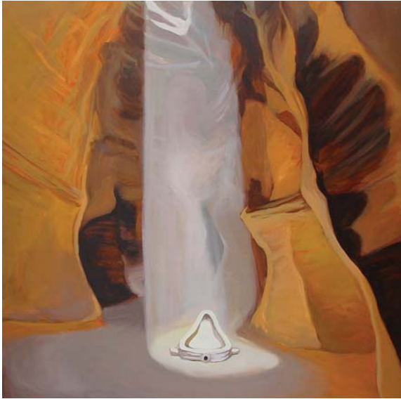
GOTAS, 2008. Óleo sobre lienzo. 65 x 92 cm.