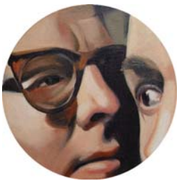
LA MIRADA PERDIDA, 2008. Óleo sobre lienzo. 65 x 92 cm. EL OJO DE GILBERT AND GEORGE, 2007. Óleo sobre lienzo. 30 cm diámetro.