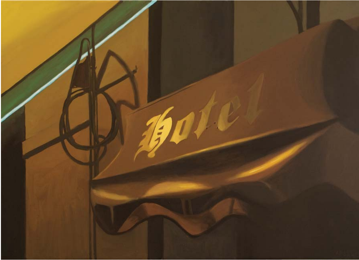
HOT HOTEL, 2008. Óleo sobre lienzo. 65 x 92 cm.