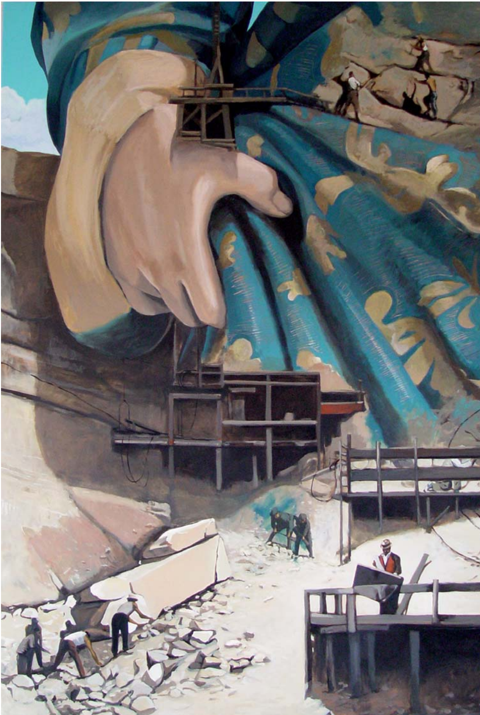
SALIZILLOS, 2007. Óleo sobre lienzo. 300 x 200 cm. Dcha.: PET, 2008. Óleo sobre lienzo. 75 x 150 cm. PORTRAIT OF THE ARTIST MIDCAREER, 2008. Óleo sobre lienzo. 75 x 150 cm.